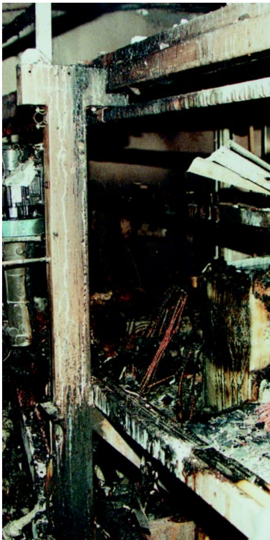
Pintakäsittelylaitoksilla sattuneet tulipalot ja muut onnettomuudet ovat merkki siitä, että turvallisuuteen ei ole kiinnitetty riittävästi huomiota.

Määräaikaistarkastus vaaditaan julkisissa rakennuksissa sekä liike-, teollisuus- ja maatalousrakennuksissa, joissa pääsulakkeet ovat yli 35A. Tavanomaisten toimitilarakennusten tarkastusväli on 15 vuotta; vaativammassa kohteissa 10 tai 5