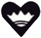
Den finländska kontrollstämpeln

Kontrollorganet har till uppgift att undersöka om en produkt överensstämmer med kraven i fråga om bl.a. finhalt och stämplarna, och har rätt att använda den finländska kontrollstämpeln "en krona i ett hjärta".